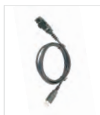
Câble de programmation (port USB)