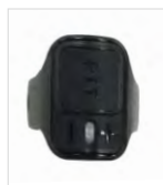
PTT de doigt sans fil