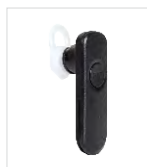
Écouteur sans fil